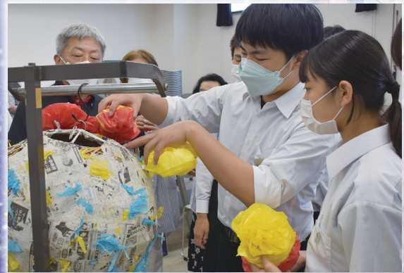
花飾りをくす玉へ取付する様子

第75回おおさき古川まつりに向けて、市内小中学生・企業団体を対象とした「ふるかわ七夕飾り製作講習会」が開催された。