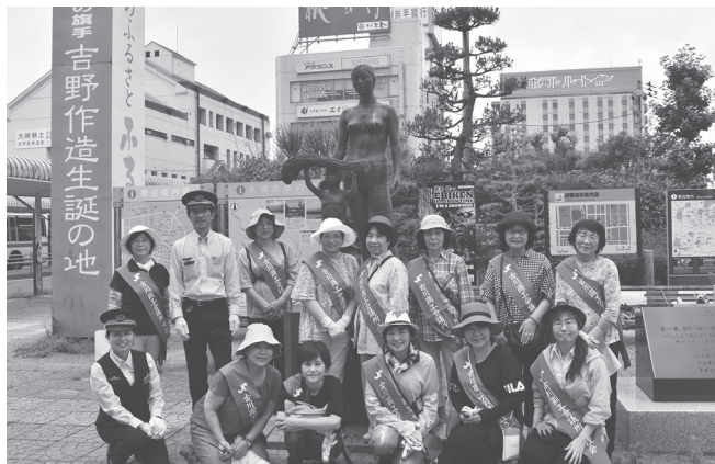
駅長さんたちと一緒に

また、今回から地域や団体が取り組むゴミ拾いの様子や成果を発信できる「ゴミ拾い促進プラットフォームピリカ」に本活動記録を投稿した。