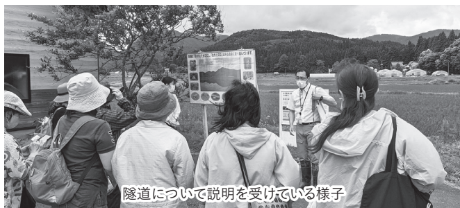
隧道について説明を受けている様子

見学後は、蛇のゆ「湯吉」にて鳴子温泉地区で作られたお米「ゆきむすび」のおにぎりを昼食にいただき温泉を楽しんだ。