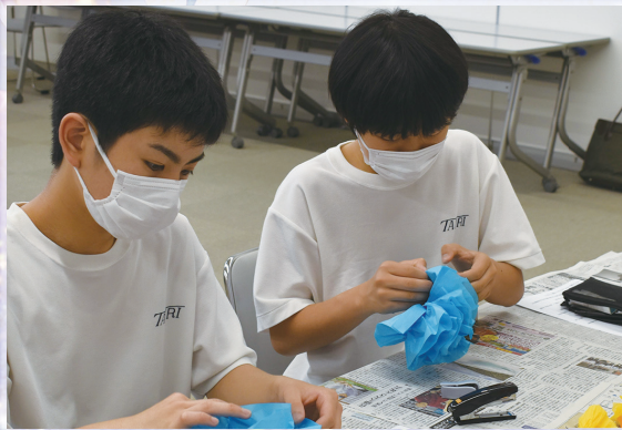
協力しながら花飾りを作る