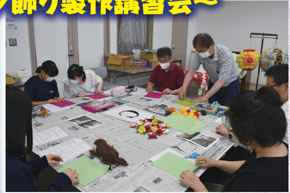
花飾りを作っている様子