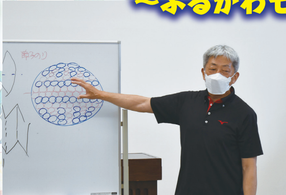
玉飾りの作り方の説明