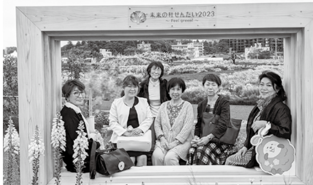
全国都市緑化仙台フェア会場内