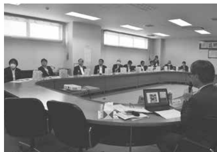
中心市街地などについて意見交換