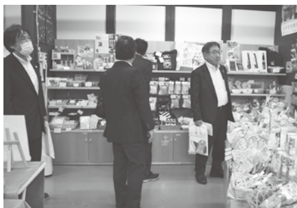
姉妹都市の商品コーナーを見学