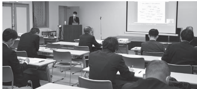
セミナー会場(リアル)の様子