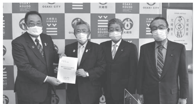
伊藤大崎市長に要望