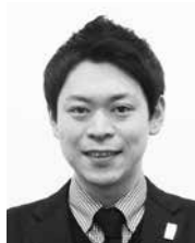
(株)松倉 代表取締役