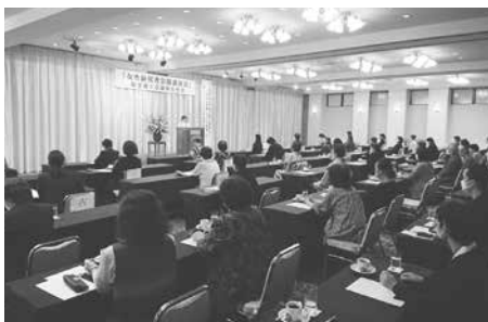
熱心に聴講する参加者