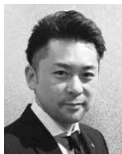
(有)サウザンドリーフ 代表取締役

微力ではございますが地域発展のため尽力して参る所存でございますので、何卒宜しくお願い致します。