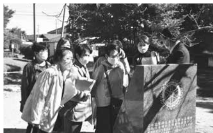
元片倉製糸工場跡地を見学