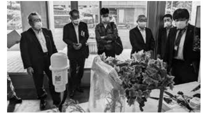
熱心に説明を聞く参加者

新型コロナウイルス感染症の拡大により働き方が大きく変わった近年、会員企業のデジタル化による生産性向上やビジネス変革などへの支援の一環でDX研修を実施した。