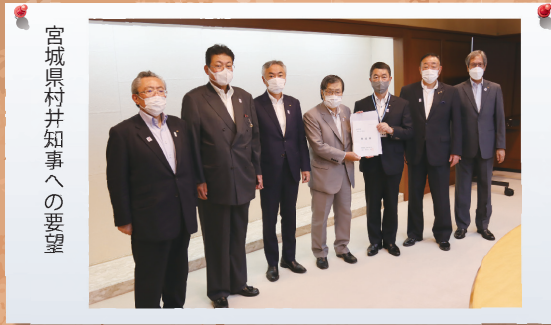
宮城県村井知事への要望