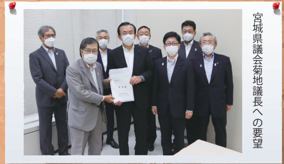
宮城県議会会長への要望