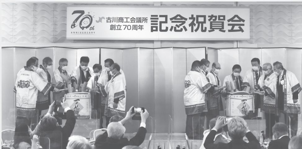
70周年を祝い鏡開きを行った