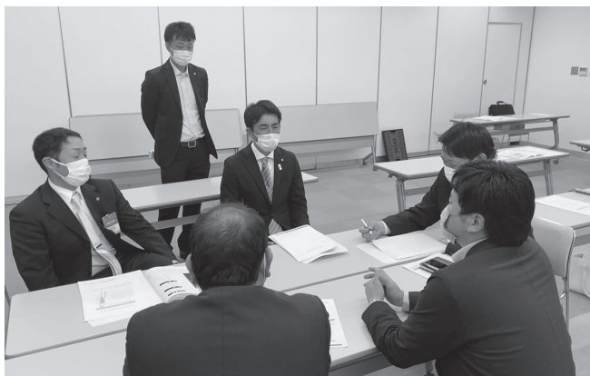
ディスカッションの様子