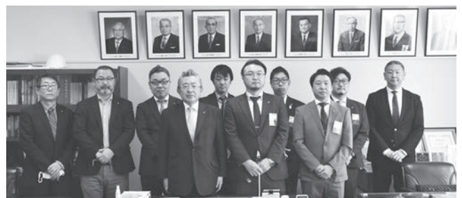
古川商工会議所四役に所信表明をしたのち記念撮影

次年度新役員が、古川商工会議所四役のもとを訪ね、中長期的な古川YEGビジョンと、2022年度事業計画について説明した。説明の後、活発な意見交換が行われ、貴重な機会となった。