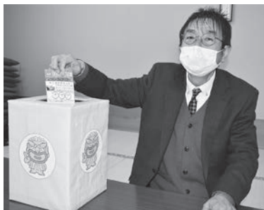
抽選する西巻商業部会長