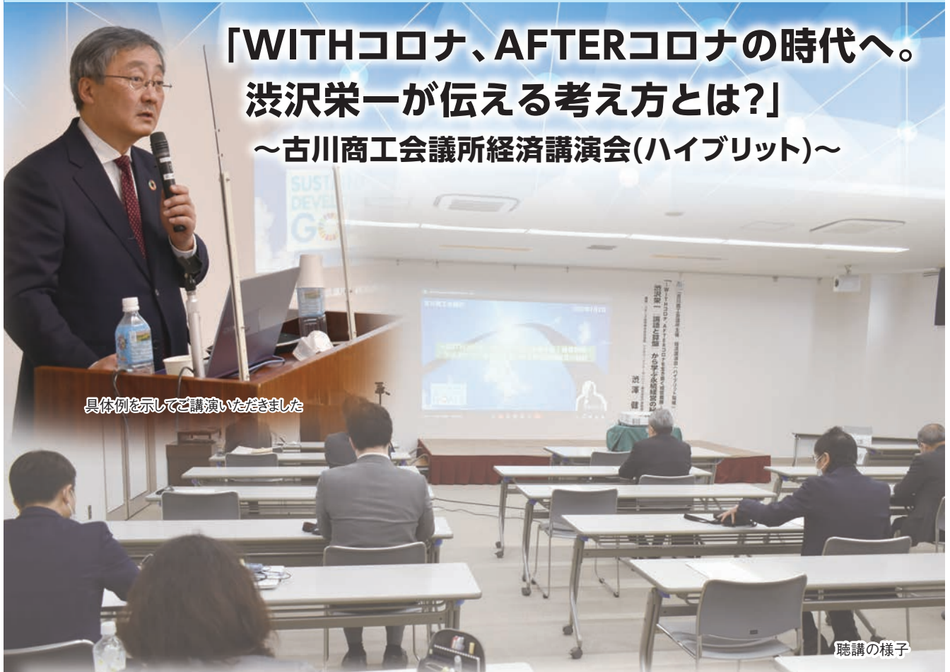
具体例を示してご講演いただきました