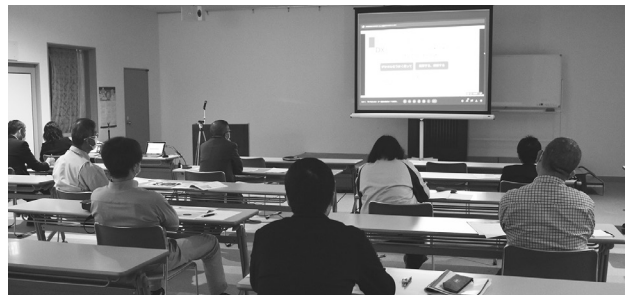
オンラインによるセミナーの様子

今回のセミナーは、DXに取り組みたいと思っている企業の方々に、ヒントになるものが見つければとのことから開催された。デジタルへの理解をより深めるため、当部会ではDXに関するセミナーを企画している。