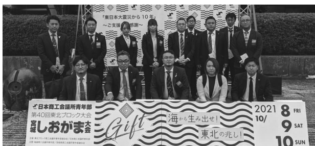
記念式典に参加した古川YEGメンバー ※集合写真は撮影時のみマスクを外します。

当日は参加者全員の抗原検査の実施など、様々な新型コロナウイルス感染症防止対策を徹底した上で執り行われ、記念式典では主催者の皆様の熱い想いのこもった挨拶があった。その後、次年度東北ブロック会長、次年度東北ブロック大会開催地である岩手県一関市(一関商工会議所青年部)の発表等があり、身が引き締まる式典となった。