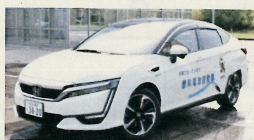
（本田技研工業CLARITY FUEL CELL）